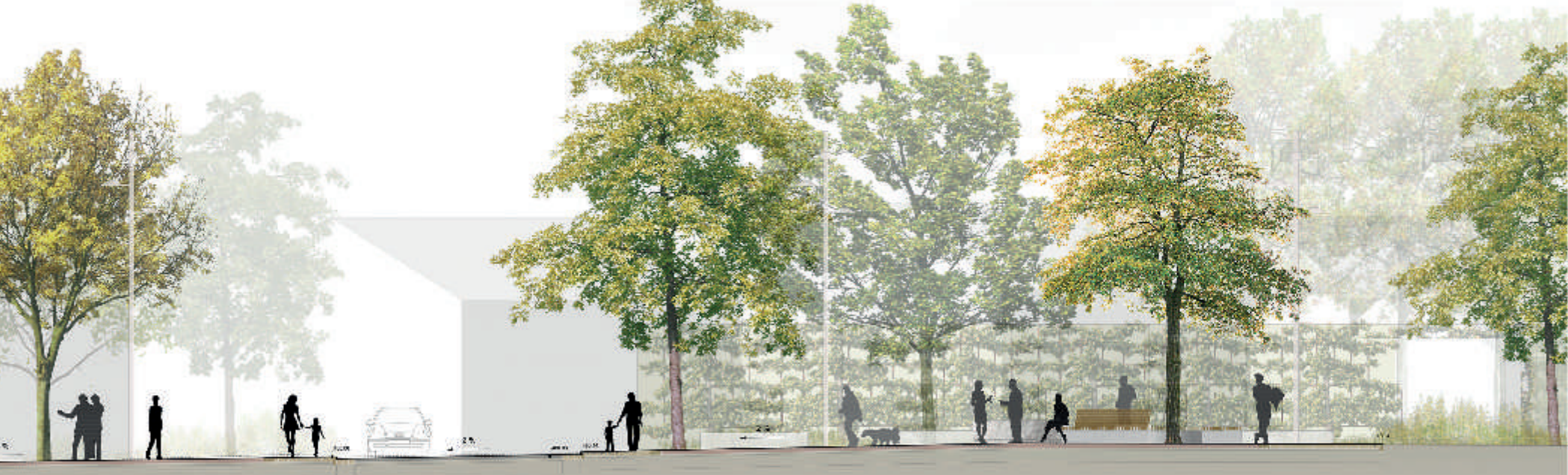
Schnitt BB M 1:50