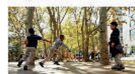
Freizeit- und Spielbereiche