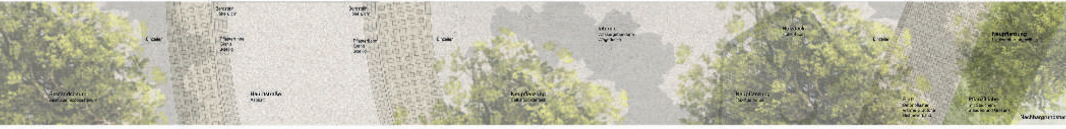
Detail BB M 1:50