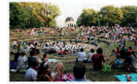
Bühne und Plätze im Stadtpark