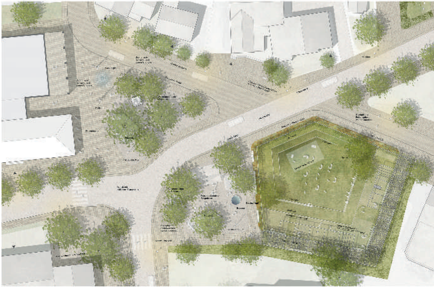
Übersicht M 1:200