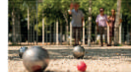
Wetliche runde Oberflächen