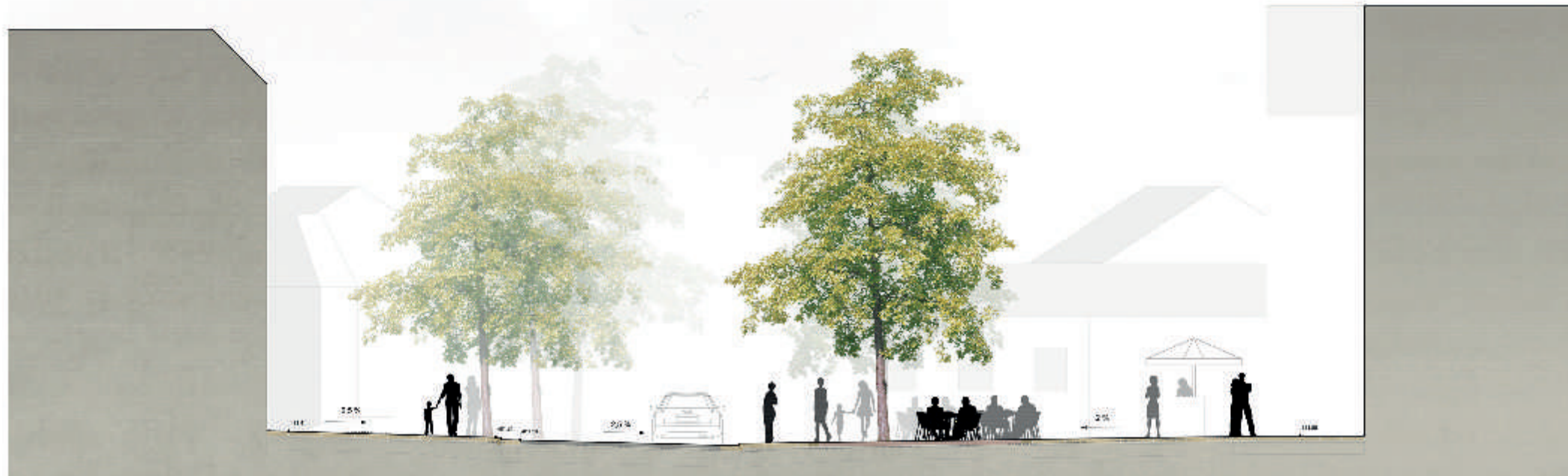
Schnitt AA M 1:50

Die Platzgestaltung ist ein zentraler Bestandteil der Stadtentwicklung. Die Platzgestaltung ist ein zentraler Bestandteil der Stadtentwicklung. Die Platzgestaltung ist ein zentraler Bestandteil der Stadtentwicklung.