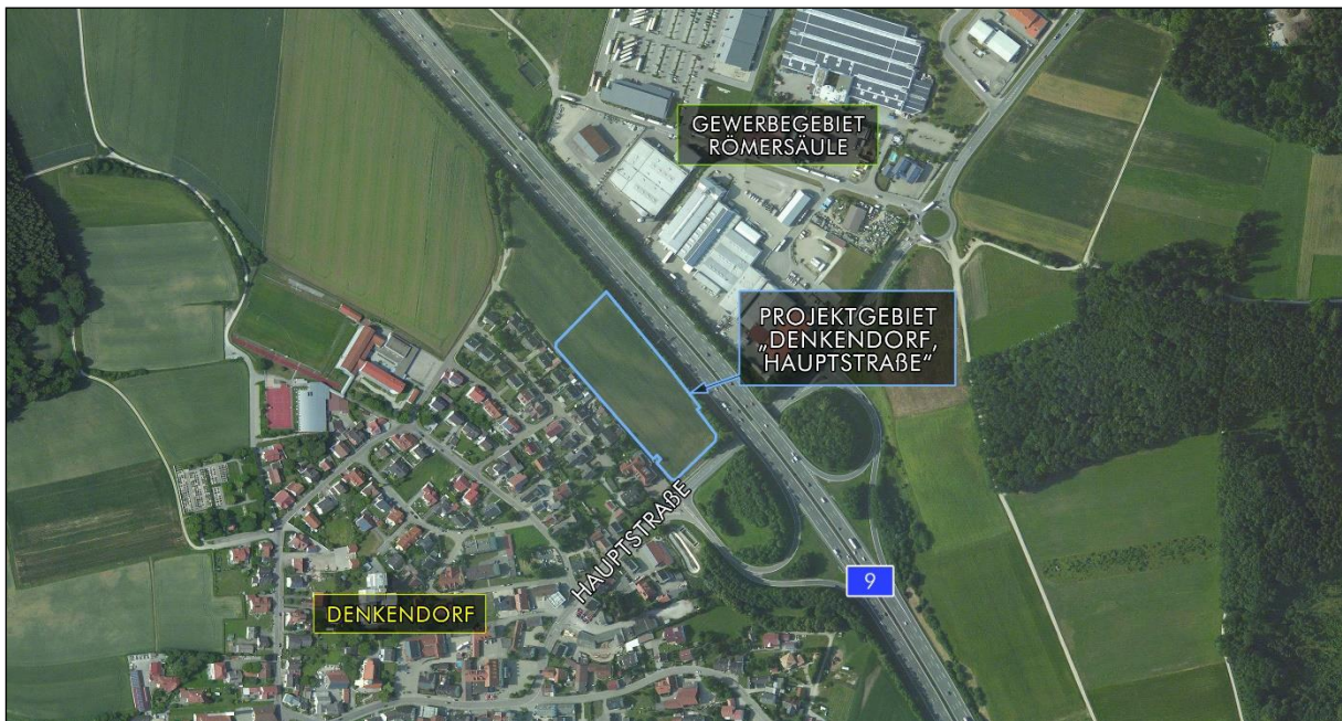
Abb. 1: Lage des Grundstücks (hellblau markiert) mit hinterlegtem aktuellem Luftbild.

Gegenstand der Luftbild- und Aktenauswertung ist ein Flurstück an der Hauptstraße in Denkendorf im oberbayerischen Landkreis Eichstätt, vgl. Abb. 1: