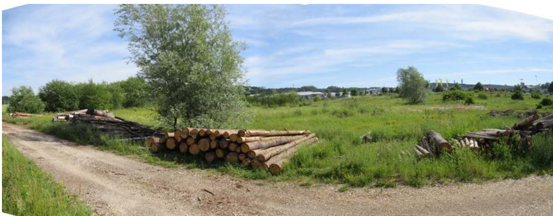
Abb. 3: Übersicht Plangebiet, Blickrichtung nach Norden

Das Planungsgebiet stellt sich zum größten Teil als Ruderalfläche mit Gehölzsukzession dar und wird zur Lagerung u.a. von Holz genutzt. Im westlichen Bereich liegt eine Teilfläche mit landwirtschaftlicher Nutzung innerhalb des Geltungsbereiches (s. Abb. 2).