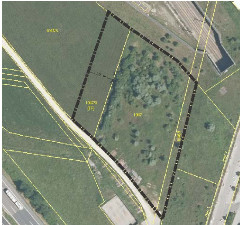
Abb. 2: Übersicht Geltungsbereich

Das geplante Gewerbegebiet liegt angrenzend an bestehendes Gewerbegebiet nördlich von Denkendorf zwischen der BAB A 9 und der Bahnstrecke Nürnberg - Ingolstadt (s. Abb. 2).